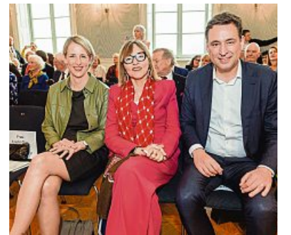
▼ Katrin Habenschaden, Dr. Beate Merk und Georg Eisenreich (v. li.).