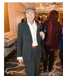
TV-Star Gaby Dohm kam auch zur Präsentation.

Seiten erinnert Andreea liebevoll an den Modeschöpfer, der 2019 starb – mit vielen Anekdoten, Fotos und Begegnungen. Die Gäste genossen Champagner, Fingerfood und eine Erkenntnis von Lagerfeld: „Man muss das Geld zum Fenster rauswerfen, damit es zur Tür wieder rein kommt.“