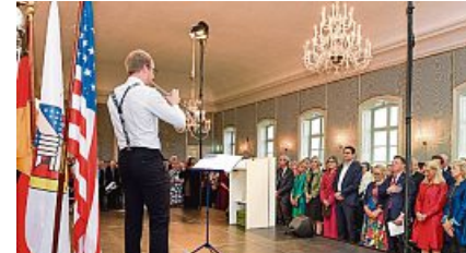
Ein Trompeter spielte die Nationalhymnen.